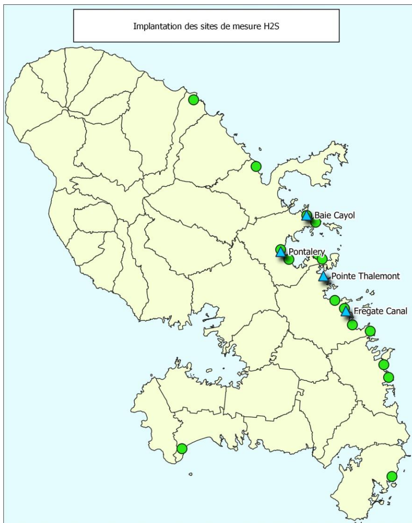
CONCENTRATIONS MOYENNES EN H 2 S SUR 24H DE 12h A 12h (EN PPM) RELEVÉES DU 13/06/2022 AU 20/06/2022

En complément du réseau de surveillance continue assurée par les dispositifs Cairpol, des appareils Dräger X-am 5000 peuvent être utilisés pour des mesures complémentaires en hydrogène sulfuré . Ces appareils peuvent, par exemple, être utilisés pour évaluer l'exposition à diverses distances au littoral, baliser une zone lors d'épisodes d'échouage massifs, etc.