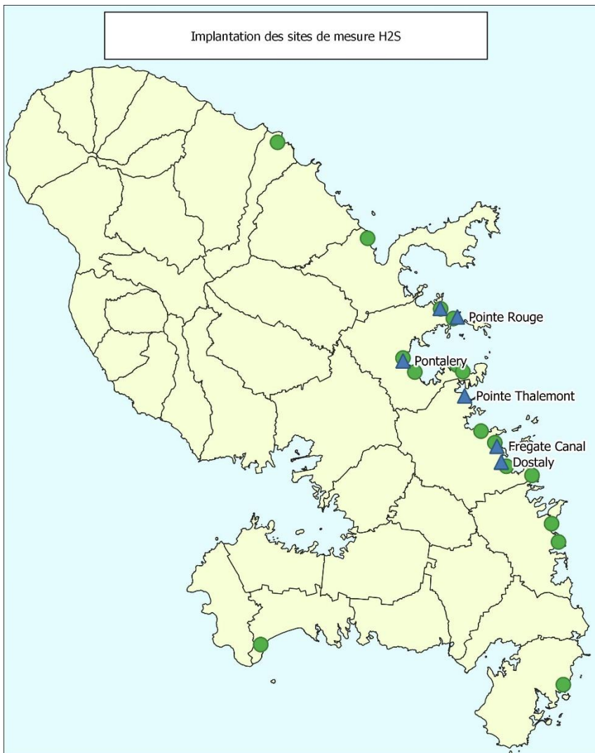
CONCENTRATIONS MOYENNES EN H 2 S SUR 24H DE 12h A 12h (EN PPM) RELEVÉES DU 23/01/2023 AU 30/01/2023

En complément du réseau de surveillance continue assurée par les dispositifs Cairpol, des appareils Dräger X-am 5000 peuvent être utilisés pour des mesures complémentaires en hydrogène sulfuré . Ces appareils peuvent, par exemple, être utilisés pour évaluer l'exposition à diverses distances au littoral, baliser une zone lors d'épisodes d'échouage massifs, etc.